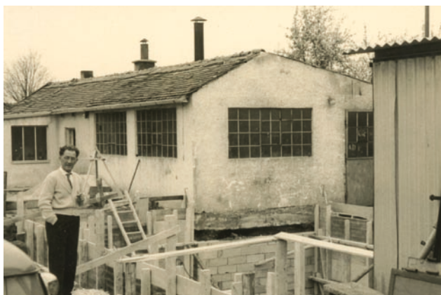
Bild 1: Keimzelle des Unternehmens Mias ist eine von Alfons Büttner sen. 1947 eröffnete Schlosserei